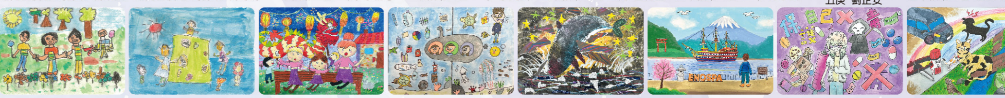
幼兒組優選 章魚班 辜釋慎 幼兒組優選 章魚班 游易豪 二年級第一名 二丙 陳高彤 二年級第二名 二甲 陳敬錄...