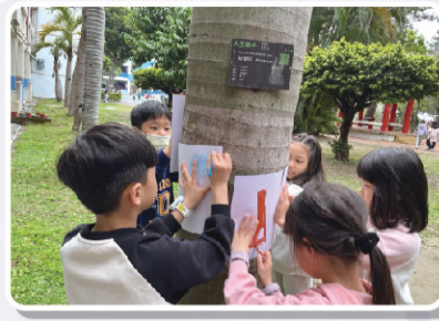
一甲 拓印校園樹木