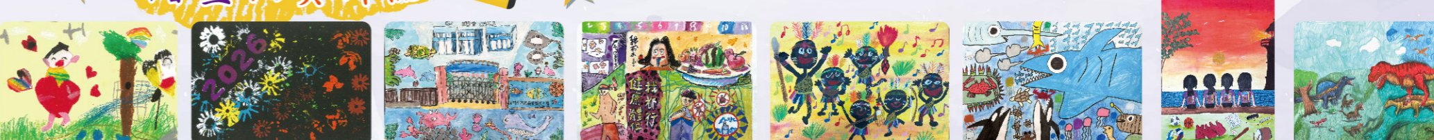
幼兒組優選 海豚班 楊秉奕 幼兒組優選 海豚班 楊時晴 一年級第一名 一戊 李侑芯 一年級第二名 一甲 李文芸...