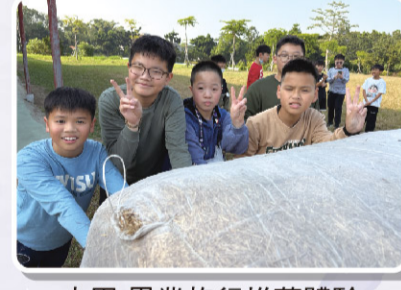
六甲 畢業旅行推草體驗