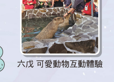
六戊 可愛動物互動體驗