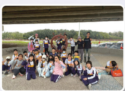
四甲 尋訪舊港大橋