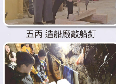
五丙 造船廠敲船釘