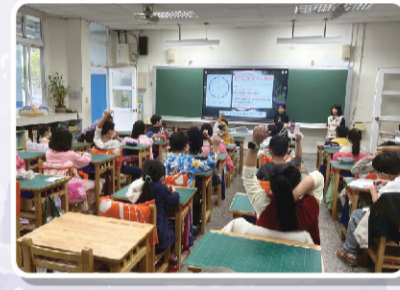
三乙 第一次班會大聲說