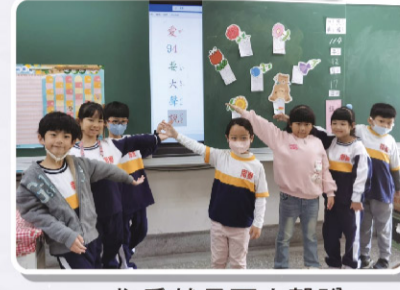
一戊 愛就是要大聲說