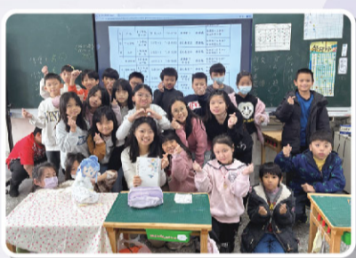
四乙 兒童節塗色活動