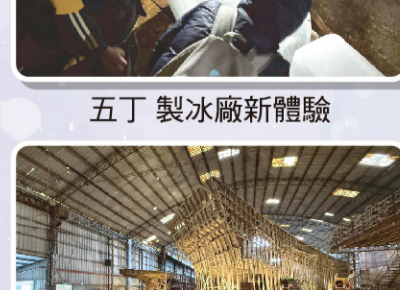
五丁 製冰廠新體驗