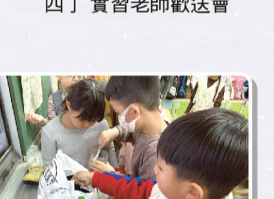
四丁 實習老師歡送會