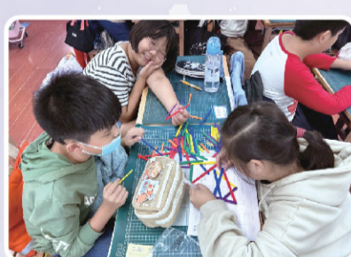
五甲 數學課扣條實作