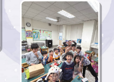
四己 樂樂棒球我最強