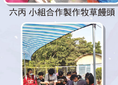
六丙 小組合作製作牧草饅頭